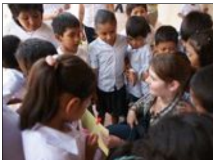
Kinder in Bolivien mit ihren Betreuern

Die Runden sind so angelegt , dass wer sehr sportlich ist, diese springen kann. Wer gerne einfach geht oder wagt, der ist genau so willkommen. Jung und alt ist willkommen, für Ru-