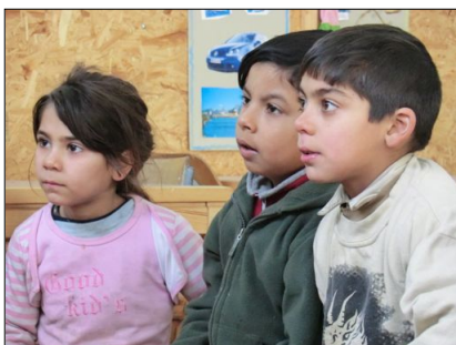
Kinder aus dem Tageszentrum in Gherla