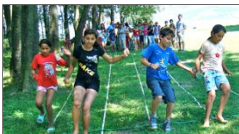
Spiel und Spass mit Gross und Klein

Wir legen diesen Newslettern eine Listen bei mit den Kindern , welche in Absprache mit den erziehungsberechtigten Personen am Sponsorenlauf teilnehmen werden. Wir würden uns freuen, wenn Sie sich für eines oder mehrere Kinder verpflichten würden, pro Runde einen Betrag zu sprechen. Senden Sie uns die ausgefüllte Liste zurück oder schreiben Sie uns ein E-Mail gherla@open-hands.ch mit den nötigen Angaben des entsprechenden Kindes.